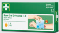
Cederoth Burn Gel Dressing REF 901900

Sterilt universalförband speciellt lämpligt för fingrar och tår. Tydliga instruktioner är tryckta direkt på förpackningen.