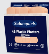
Salvequick Plastplåster REF 6036

Varje refill innehåller 45 plåster (27 st 72 x 19 mm och 18 st 72 x 25 mm). 6 refiller/ask.