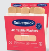
Salvequick Textilplåster REF 6444

Varje refill innehåller 45 plåster (27 st 72 x 19 mm och 18 st 72 x 25 mm). 6 refiller/ask.