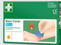
Cederoth Burn Cover REF 901903

Brännskadekompress som ger snabb avkylning och effektiv smärtlindring vid första och andra gradens brännskador. Steril kompress 20 x 20 cm.