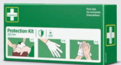
Cederoth Skyddspaket REF 2596

Vattenbaserad gel för mindre brännskador, skällningar och solsveda. Fungerar som en tillfälligt skyddande barriär som kyler och lugnar huden och därmed minskar smärtan. Kan användas flera gånger.