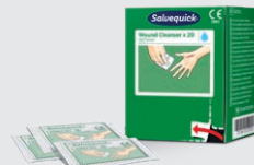
Salvequick Sårsvättare 20 st REF 323700

150 ml steril koksaltlösning för att rengöra samt skölja bort damm och smuts ur ögon och sår. Sprayen kan användas flera gånger och är steril till sista droppen. Hållbarhetstid 5 år.