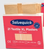
Salvequick Extra Stora Textilplåster, REF 6470

Varje refill innehåller 40 plåster (24 st 72 x 19 mm och 16 st 72 x 25 mm). 6 refiller/ask.