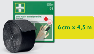
Cederoth Soft Foam Bandage Black 6 cm x 4,5 m, REF 51011021

Limfritt, självhäftande plåster som lätt kan rivas av efter önskad storlek. Passar på alla mindre sår och sitter kvar oberoende av värme, kyla, vått eller torrt. Refill till First Aid & Burn Station.