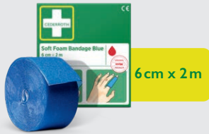
Cederoth Soft Foam Bandage Blue 6 cm x 2 m, REF 51011011

Limfritt, självhäftande plåster som lätt kan rivas av efter önskad storlek. Passar på alla mindre sår och sitter kvar oberoende av värme, kyla, vått eller torrt. Refill till First Aid & Burn Station.