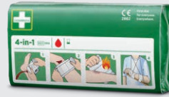
Cederoth 4-in-1 Blodstoppare REF 1910

Limfritt, självhäftande plåster som lätt kan rivas av efter önskad storlek. Passar på alla mindre sår och sitter kvar oberoende av värme, kyla, vått eller torrt. Refill till Soft Foam Bandage 2-in-1 Dispenser.