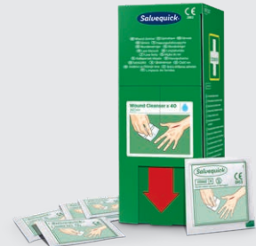
Salvequick Sårsvättare 40 st REF 3227

Ersätter bomull och sårsvättnings i flaska. Innehåll: 20 st Salvequick våtservetter med 0,9 % koksaltlösning. Styckförpackade. Passar Första Hjälp-stationen.