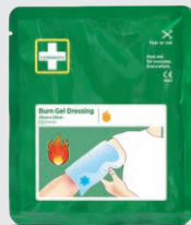
Burn Gel Dressing 20 x 20 cm REF 51011015

Ger snabb avkylning och effektiv smärtlindring vid brännsår och solbränna. Cederoth Burn Gel kyler lika effektivt som ljummet vatten och påskyndar därmed läkningsprocessen.