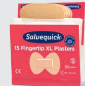
Salvequick Fingertoppplåster REF 6454

Varje refill innehåller 21 plåster (14 st 80 x 30 mm och 7 st 80 x 60 mm). 6 refiller/ask.